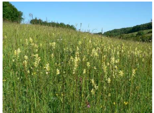
Prairie naturelle sur coteaux secs

Pour ce faire, un programme complet est prévu pour les accompagner dans la restauration et la gestion durable des milieux liés à l'élevage et valoriser leurs actions.